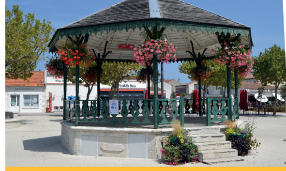
Kiosque à musique

21 œuvres d'art exposées sur des façades de la ville se dévoilent au fur et à mesure de votre déambulation dans le cœur historique de Saint-Pierre d'Oléron. Crapeurs, photographes, peintres, dessinateurs... de nombreux styles artistiques nous surprennent aux quatre coins du centre-ville. Un moyen formidable de découvrir les lieux de vie du bourg !